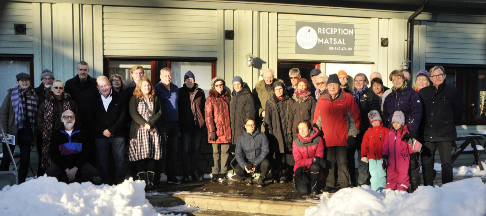
Ett trettiotal skärgårdsbor från olika medlemsföreningar kom till Svartsö för att delta Skärgårdarnas Riksförbunds representantskapsmöte i november.