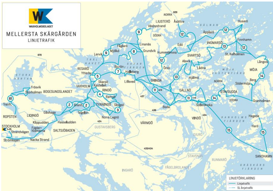
Bild. Linjekarta på mellersta skärgården