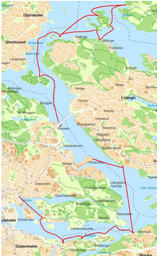
Bild. Linjekarta på SL linje 80 och WÅAB linje 81